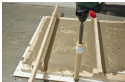
23. Gründlich arbeiten. Eventuelle Luftpinschlüsse ergeben Löcher in der Arbeitsplatte, die sich nicht mehr beheben lassen.