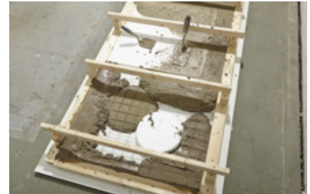
21. Das Armierungsgitter muss vollständig mit Beton bedeckt sein.