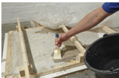
26. ... und immer wieder mit Wasser befeuchten.