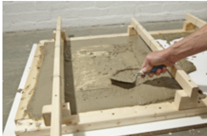
20. Masse mit der Kelle gut verteilen.