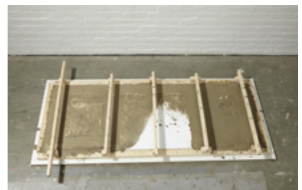
24. Blick auf die gegossene, gut gerüttelte Arbeitsplatte.