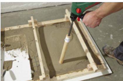
22. Den Beton mit dem Behelfs-Betonrüttler an vielen Stellen einrütteln – nur mit Schlag arbeiten, die Bohrfunktion (Drehung) ist ausgeschaltet.