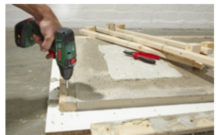
27. Die Trocknungszeit ist auf der Verpackung angegeben. Danach kann das Werk „entpackt“ werden.