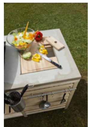
Aussparungen – hier für Grill, Getränkékühler und Schneidebrett – beim Guss berücksichtigen.