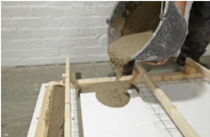
19. Betonmasse eingießen.