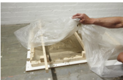
25. Der Beton muss mit dem Anmischwasser reagieren und darf daher nicht austrocknen. Während des Aushärtens mit Folie abdecken...